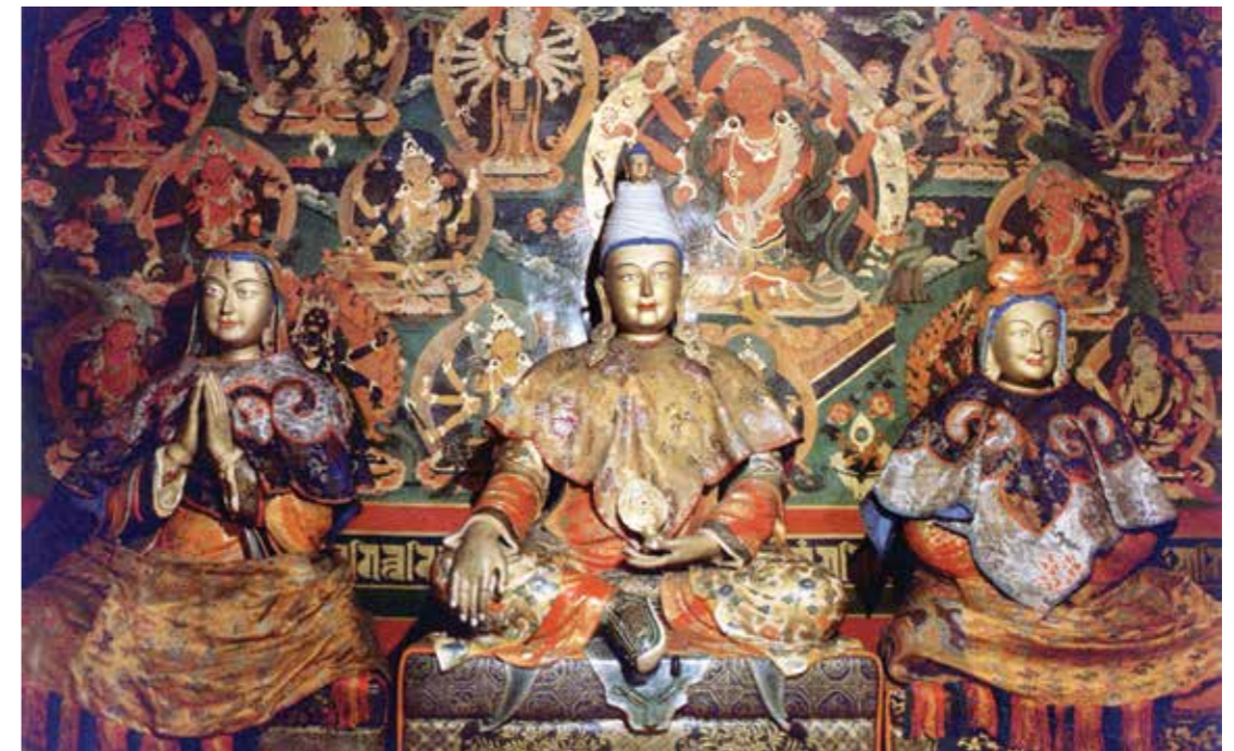
Đức Vua Songsten Gampo, vị Phật tử đầu tiên của Tây Tạng là một hóa thân chuyển thế đời trước của Đức Pháp Vương